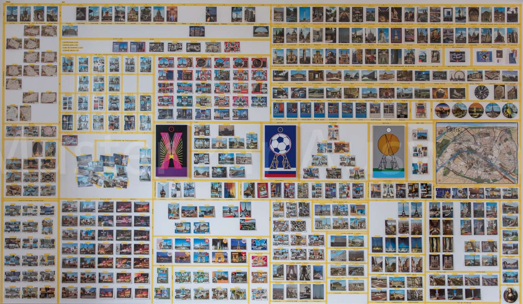
Konstantin Voit: THE END OF THE STORY IS NOT WRITTEN YET, ca. 500 Postkarten aus Paris + 3 Eiffelturm-Editionen (je 50 x 30 cm), gesamt ca. 300 x 450 cm Ausstellung GESTALTUNG DER ZUKUNFT, Stipendiat*innen des Künstlerhauses Schloss Balmoral, Bad Ems im Forum Alte Post Pirmasens, 2019