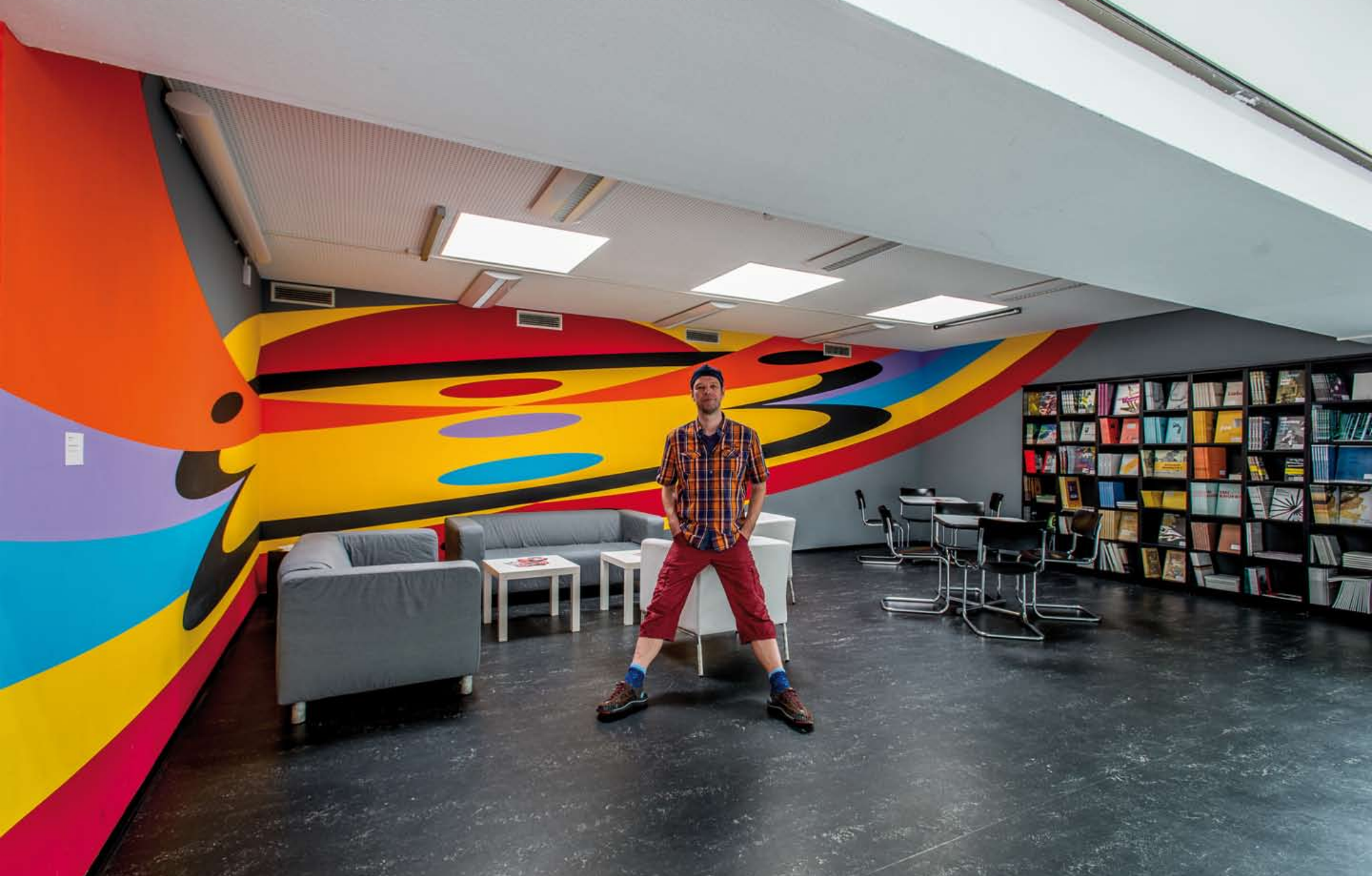
Konstantin Voit: SOMEWHERE OVER THE RAINBOW, Wilhelm-Hack-Museum, Ludwigshafen am Rhein Wandmalerei, Gesamtgrösse: ca. 2,5 x 15m, Realisierung: 2014/15, ständige Installation bis April 2018