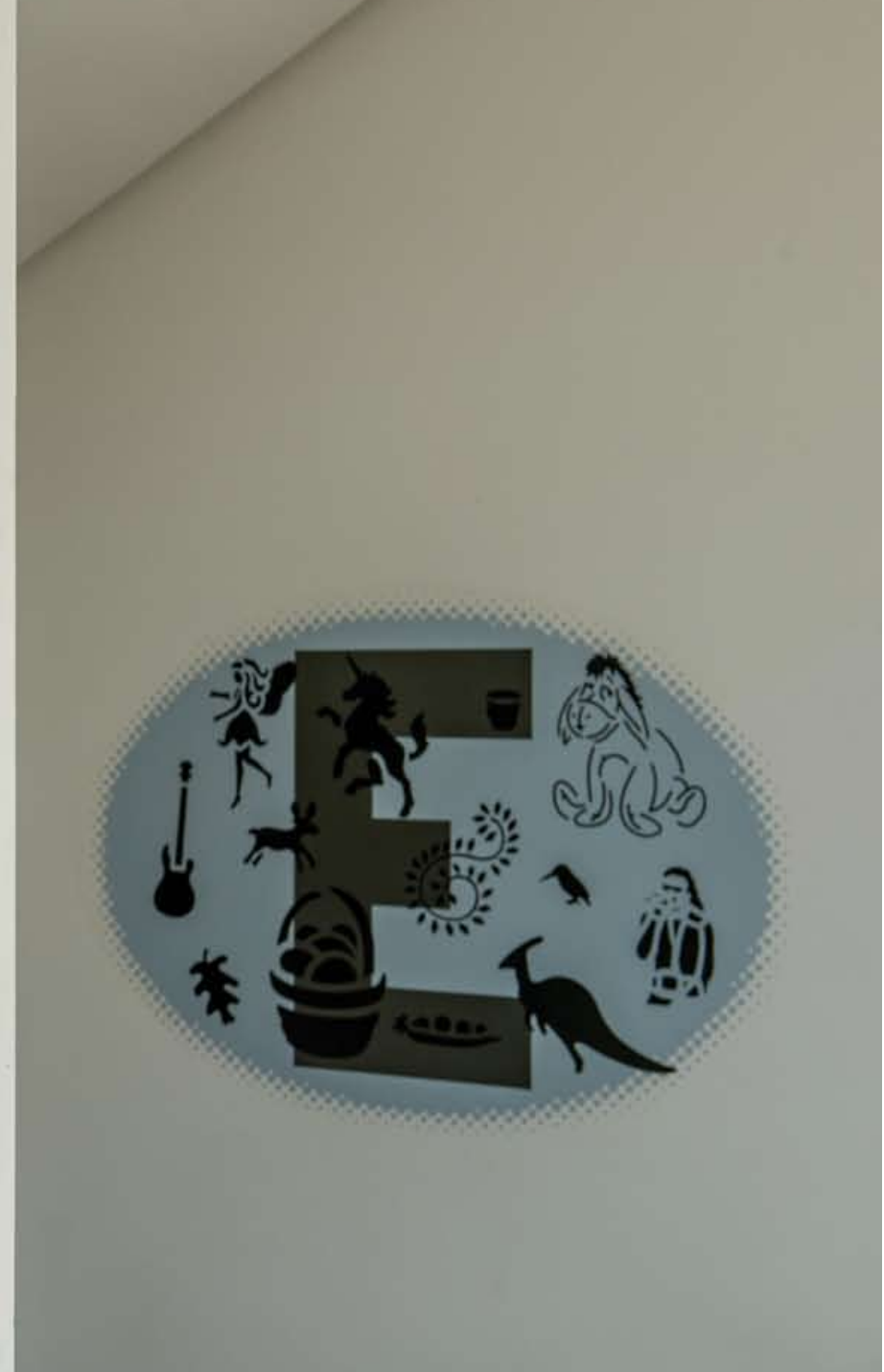
Konstantin Voit: Kunst am Bau-Projekt 2016, Erich Kästner-Schule, Ludwigshafen am Rhein Treppehaus 1: Flaggenwand (Detail) + ABC-Wolken (Buchstabe E), Durchmesser in der Breite ca. 1,2 m, Wandfarbe