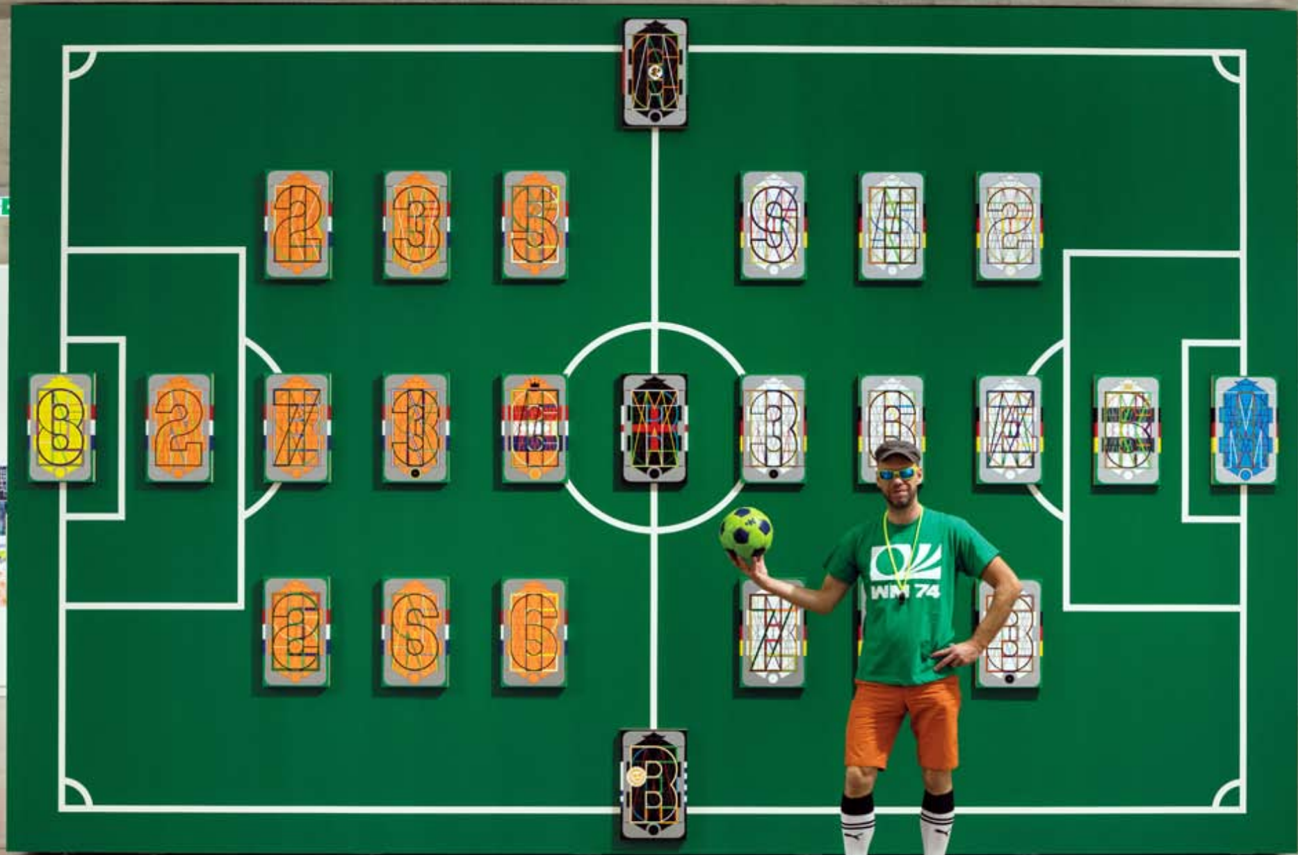
Konstantin Voit: WM-FINALE 1974 Holland - BR Deutschland 1:2, Port25 – Raum für Gegenwartskunst, Mannheim 2017

25 Bilder (11 Spieler je Mannschaft + 3 Schieds-/Linienrichter), jeweils 50 x 30 cm, Acryl auf Holz, auf Wandmalerei, gesamt: 390 x 590 cm