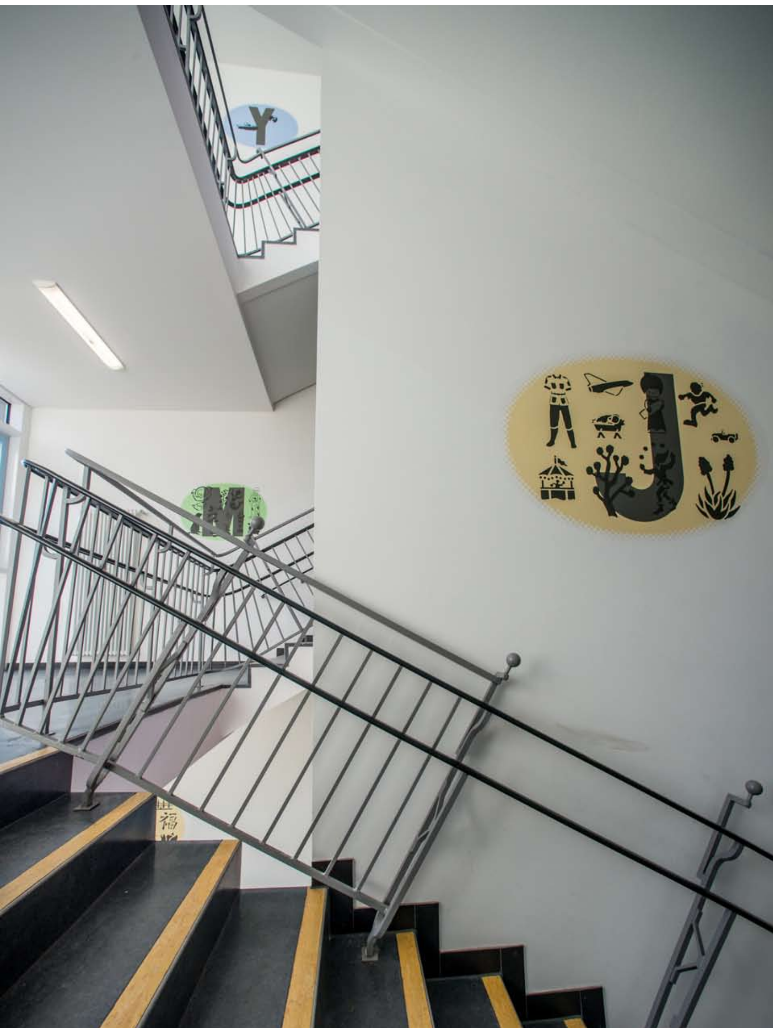
Konstantin Voit: Kunst am Bau-Projekt 2016, Erich Kästner-Schule, Ludwigshafen am Rhein Treppenhaus 1: ABC-Wolken (Buchstaben Y, M, J), Durchmesser in der Breite jeweils ca. 1,2 m, Wandfarbe