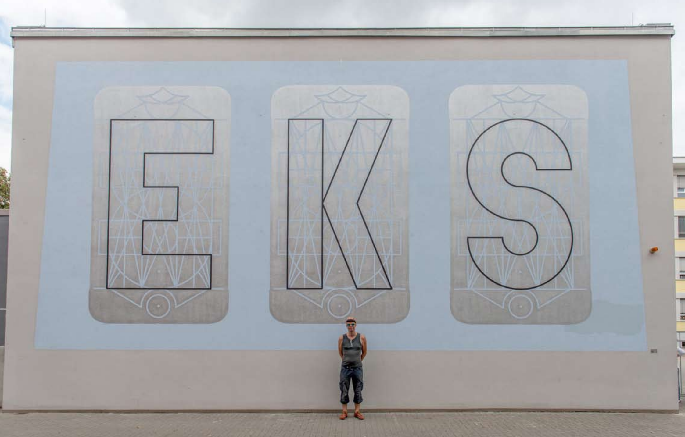
Konstantin Voit: Kunst am Bau-Projekt 2016, Erich Kästner-Schule, Ludwigshafen am Rhein Außenwand Turnhalle, PDU: EKS (Initialien der Schule), ca. 5 x 10 m, Wandfarbe/Silber