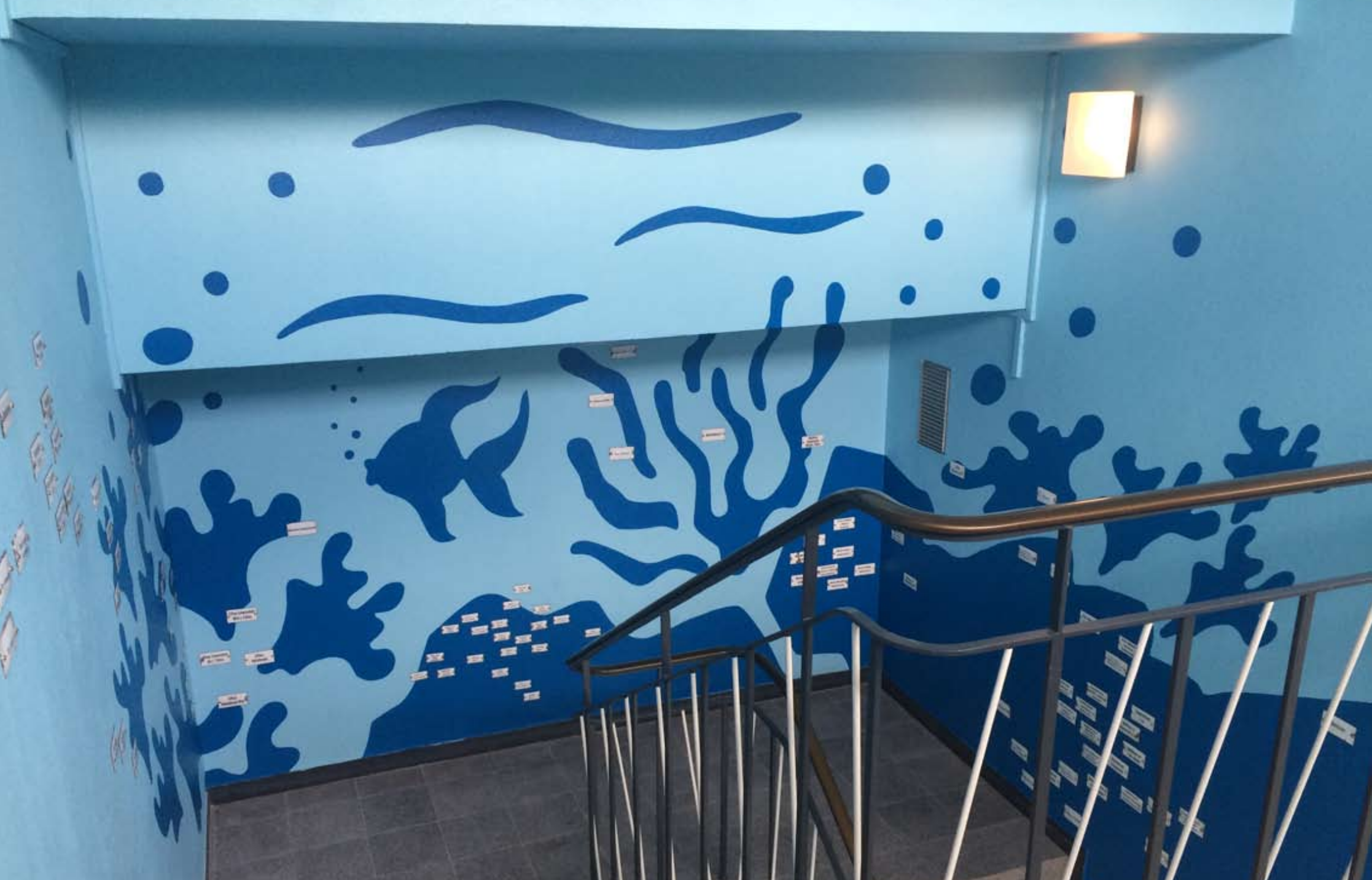
Konstantin Voit: Kunst am Bau-Projekt 2019, ehemaliges Hallenbad Nord (LUcation), Ludwigshafen am Rhein Treppenaufgang rechts: Themenbereich WASSER, 110 ehemalige Emaille-Schilder aus dem Hallenbad auf Wandmalerei, ca. 3 x 7 m