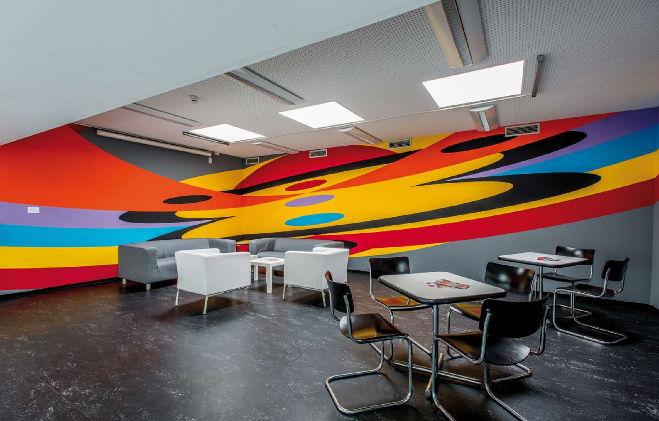
Konstantin Voit: SOMEWHERE OVER THE RAINBOW, Wilhelm-Hack-Museum, Ludwigshafen am Rhein Wandmalerei, Gesamtgröße: ca. 2,5 x 15m, Realisierung: 2014/15, ständige Installation bis April 2018