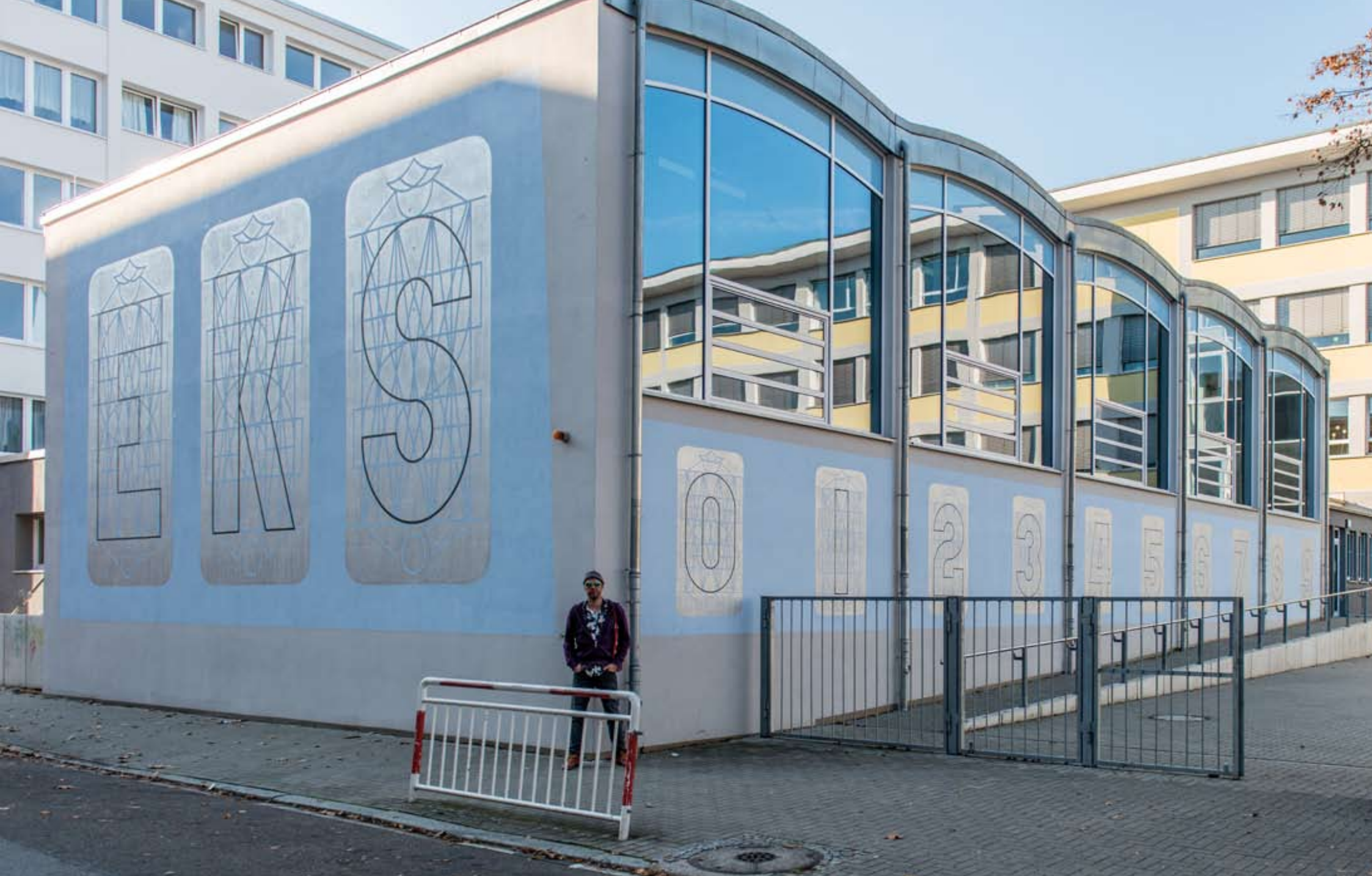
Konstantin Voit: Kunst am Bau-Projekt 2016, Erich Kästner-Schule, Ludwigshafen am Rhein Außenwand Turnhalle, PDU: EKS (Initialien der Schule), ca. 5 x 10 m und Zahlen 0-9, ca. 2 x 25 m, Wandfarbe/Silber