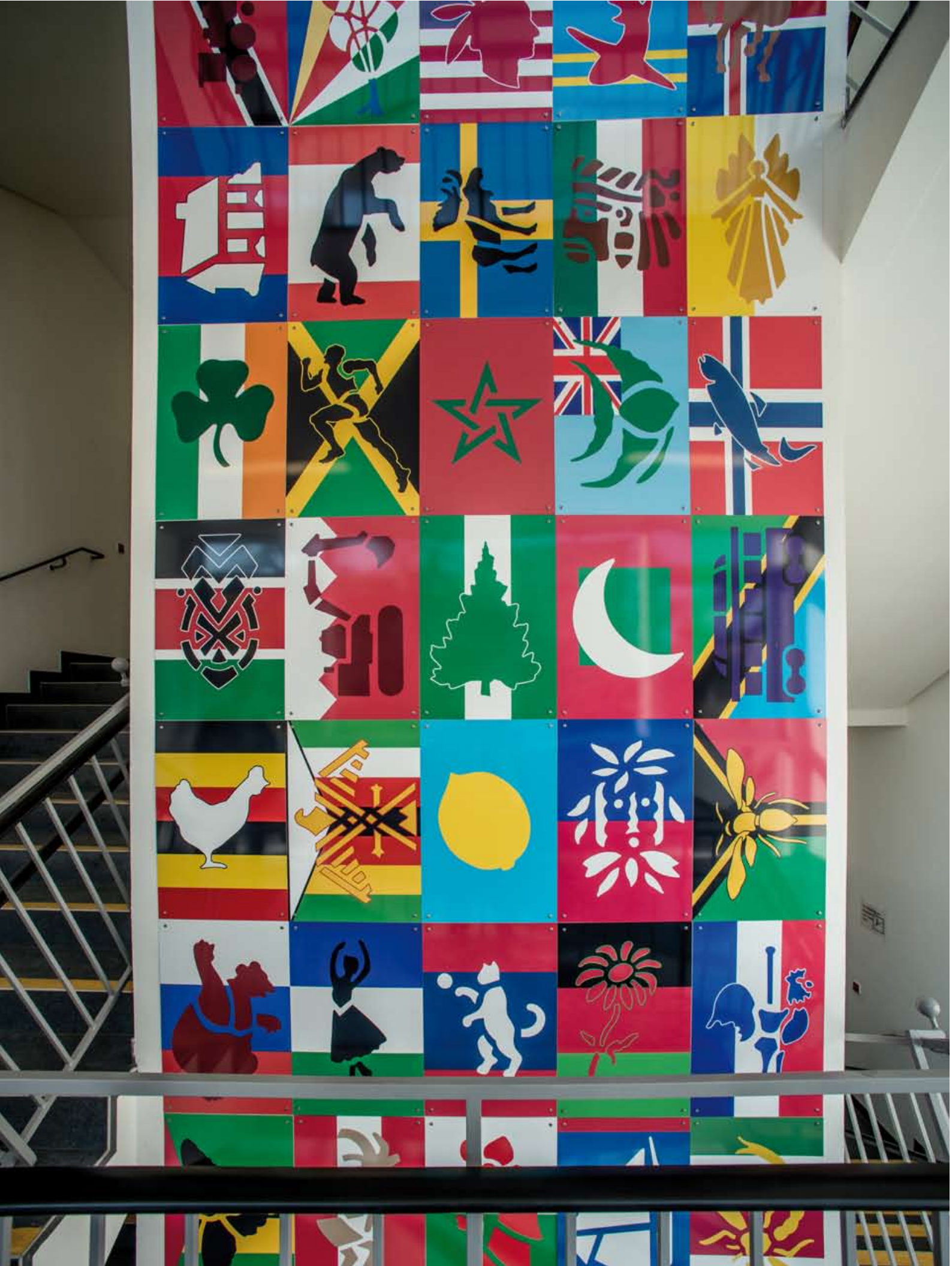
Konstantin Voit: Kunst am Bau-Projekt 2016, Erich Kästner-Schule, Ludwigshafen am Rhein Treppenhaus 1: Fahrstuhlschacht, Flaggenwand (Detail), je 60/40 cm, Digitaldruck auf Aluminium